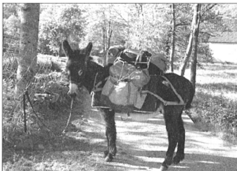
Le 6 juin, l'âne sera la star du marché de Prayols

Au mois d'avril c'est un marché aux plantes qui devrait frapper en quelque sorte les trois coups, puis rendez-vous le dimanche 6 juin pour un marché consacré à l'âne. Le principe ? Une ballade matinale pour une soixantaine de personnes au pas de l'âne, trois exactement. C'est Jean-Claude Rivère également membre des Isards de la Barguillère qui sera chargé du tracé et de l'encadrement avec des animateurs diplômés : "En général, ce sont des